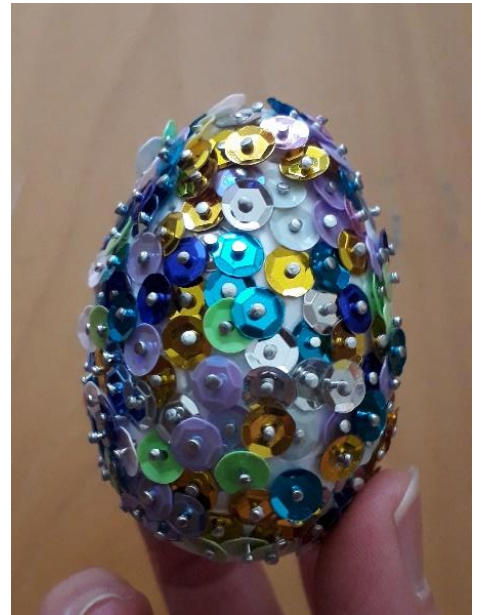
Zapisala: Maja Zbašnik